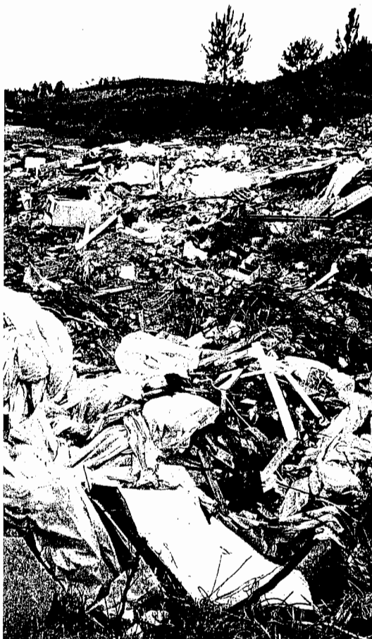
Esta imagen, captada en el parque de O Xurés, es habitual en Galicia