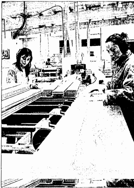
Empleados de una fábrica maderera.

En Reino Unido, por ejemplo, el sector energético, según la patronal maderera, puede añadir hasta 92 euros por tonelada en la compra del material gracias a los subsidios